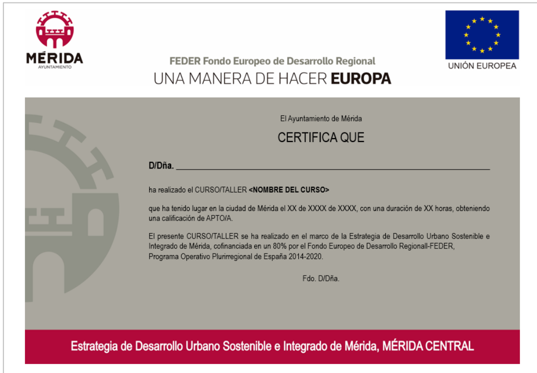
Plantilla para Certificado/Diploma ARCHIVO: Certificado EDUSI_N.pptx