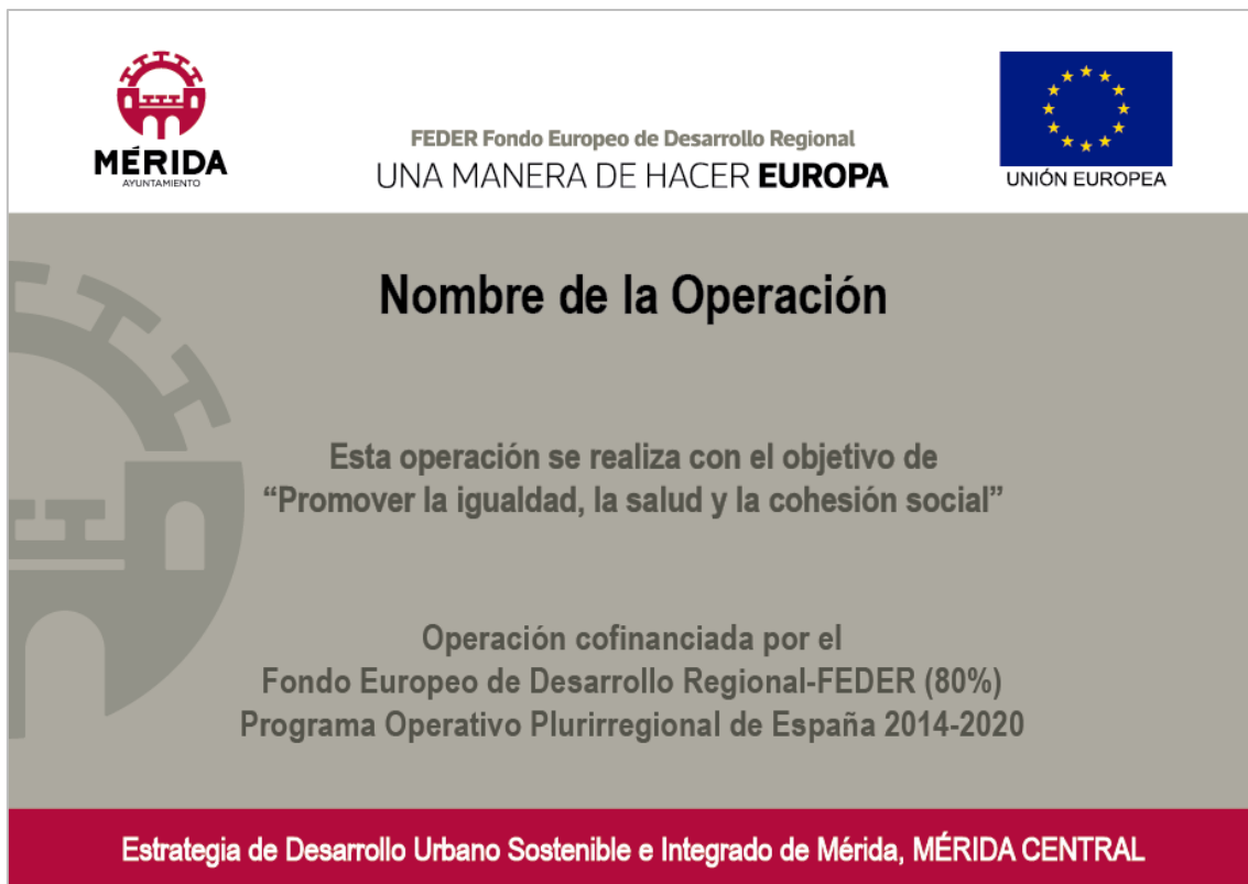
Ejemplo de cartel de operación, en tamaño A3. ARCHIVO: Cartel operaciones A3_N.pdf (editable)