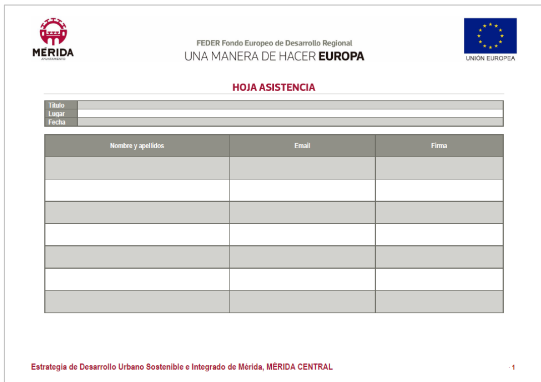
Plantilla para Hoja de firmas ARCHIVO: Hoja de firmas EDUSI_N.docx