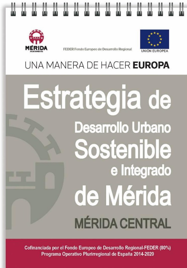
Ejemplos de material promocional impreso sobre diferentes soportes y materiales: libreta, bolsa tela...